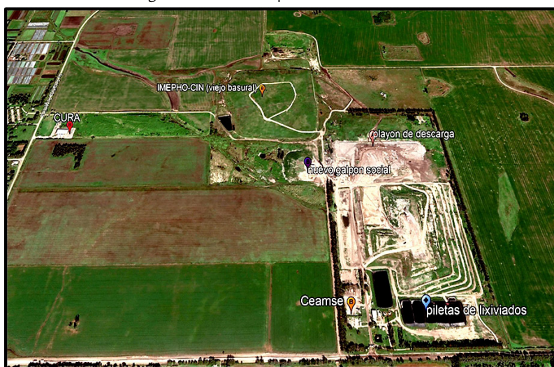
Imagen 2. Predio de disposición final de residuos