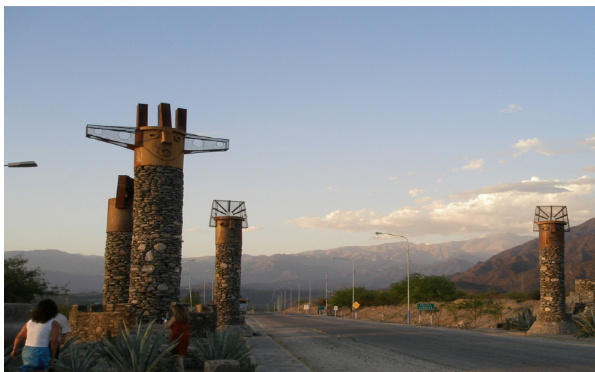
Fotografía 1. Ingreso a la ciudad de Andalgalá

Para el año 2010 los habitantes de Andalgalá, localidad de la Fotografía 1, reaccionaron al movimiento de maquinaria que anunciaba actividad y futura puesta en marcha del megaproyecto minero denominado Agua Rica, proyecto propiedad de Yamana Gold S.A., que tiene la particularidad de estar ubicado próximo a las nacientes de los dos cursos de agua que abastecen y dan vida a la ciudad de Andalgalá y distritos (zonas rurales aledañas). Este emprendimiento se ubica en línea recta a 25 kilómetros de la ciudad. Su presencia y trunca puesta en marcha ha desatado una serie de manifestaciones desde las cuales, a partir de aquel acontecimiento del 15 de febrero del año 2010, adquirió visibilidad la lucha de los sujetos de Andalgalá.