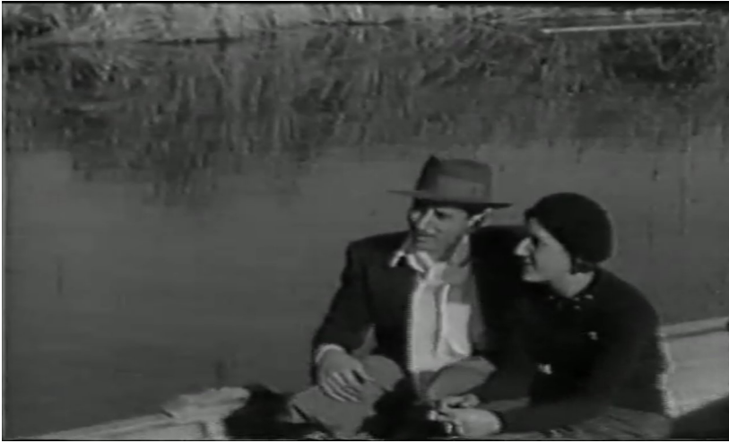
Figura 1. Fotograma de La chacra de Don Bautista (Atilio Piacenza, 1938)

Este panorama permite dar cuenta de los modelos dominantes, dentro de lo que se puede pensar como cines regionales, en la primera mitad del siglo XX. Sin embargo, resulta pertinente retomar las observaciones de Flores (2019), quien, a partir de los conceptos de Marcelo Marchionni, señala que “podemos tener la imprecisión de considerar cine regional a cualquier tipo de fenómeno que esté circunscripto a determinado espacio, considerando regionales tanto a los films que se producen en una provincia o conjunto de provincias como a los que se realizan específicamente en un pueblo o ciudad, más asociado a una idea de cine local” (p. 288). Al pensar en los cines regionales en el período clásico, lo regional y lo local suele ser tratado del mismo modo, y es así que experiencias como la de Payén y la de Film Andes quedan incluidas en un mismo grupo, bajo un criterio estrictamente geográfico.