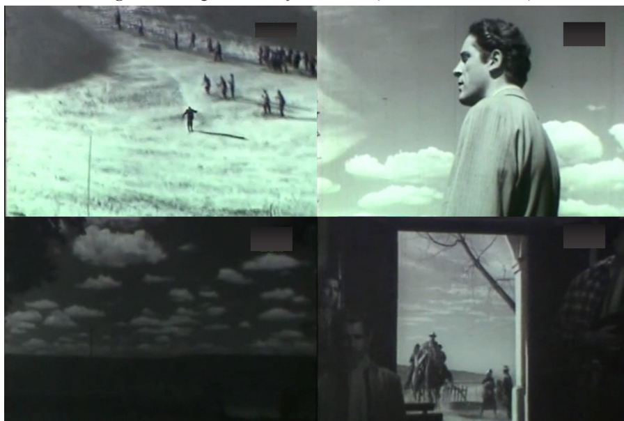
Figura 3. Fotogramas de Lejos del cielo (Catrano Catrani, 1950)

filmando en medio de la cordillera, la representación de los espacios al aire libre apuntó tanto a un uso narrativo como a una espectacularización centrada en hacer visible su majestuosidad.