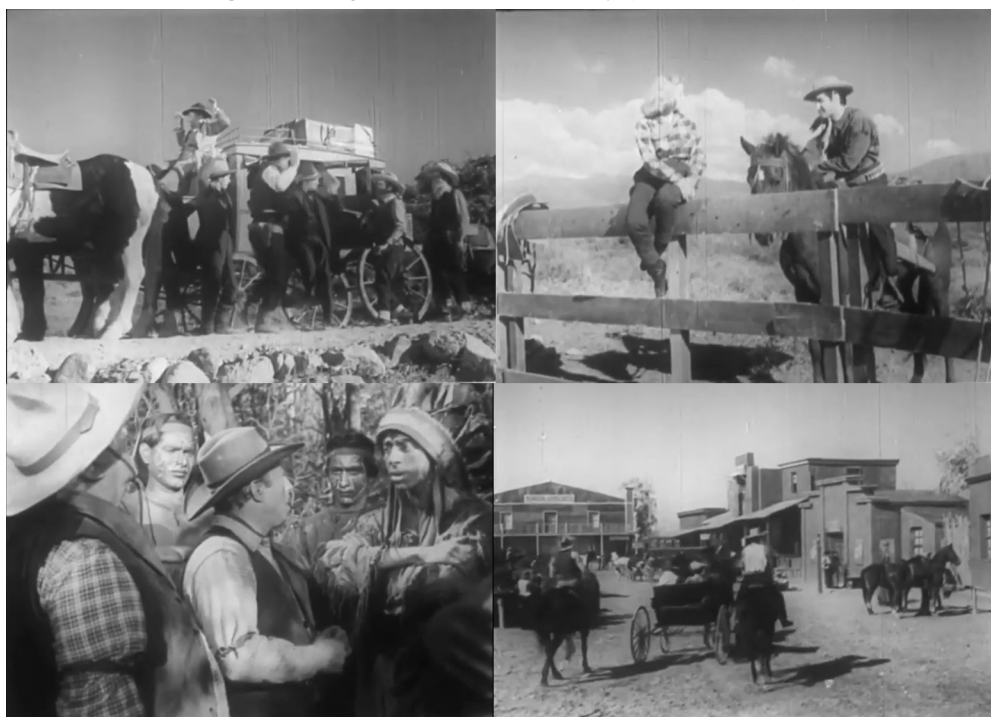
Figura 5. Fotogramas de El último cowboy (Juan Sires, 1954)

La película contó con una gran producción que incluyó escenas de ataques de indios, diligencias cruzando las montañas y la construcción de todo un pueblo del Oeste realizada por Giulio Papini. Sin hacer referencias al criollismo o a la gauchesca, se planteó completamente como una parodia que deconstruía el cine del oeste, explicitaba