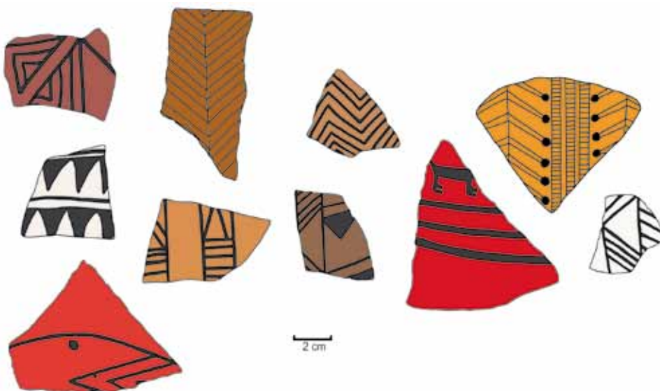
Figura 3. Fragmentos representativos del estilo Inka provincial de El Shincal (zona de descarte).