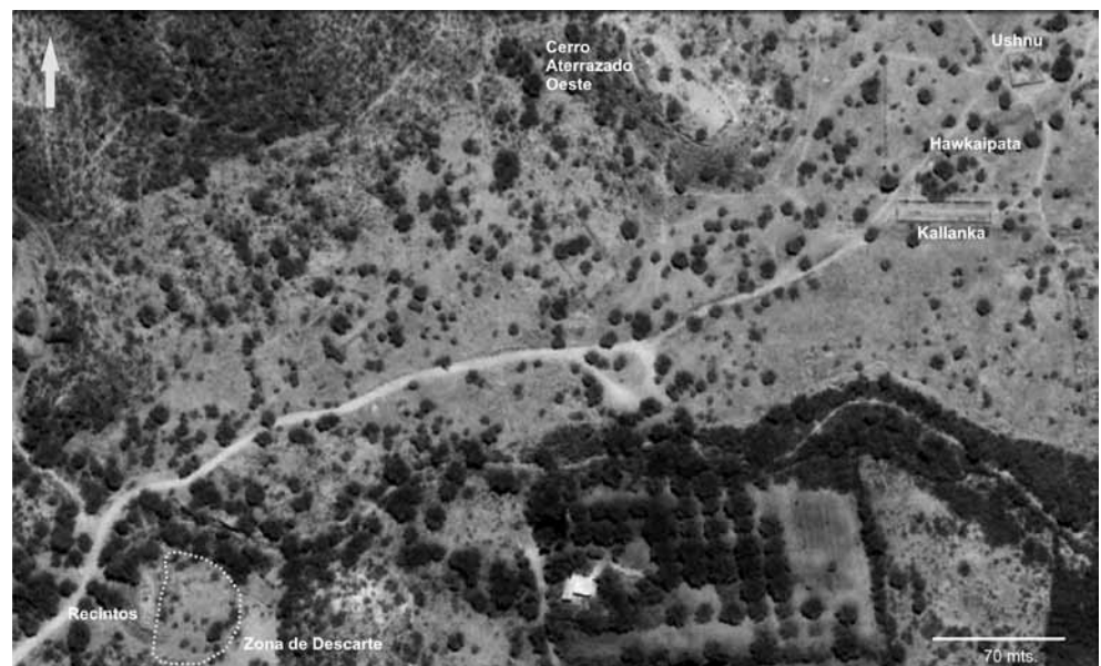
Figura 2. Ubicación de la zona de descarte (punteado) en relación con otras estructuras del sitio.

Este espacio no presenta construcción alguna sobre su superficie pero, en cambio, ha exhibido una inusual concentración de fragmentos cerámicos. Sólo por poner un ejemplo, mencionamos que hemos realizado recolecciones superficiales en otros sectores