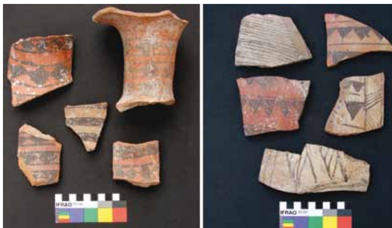
Figura 4. Fragmentos Inka provincial pertenecientes a cuellos (izquierda) y cuerpos (derecha) de aríbalo o aribaloide.