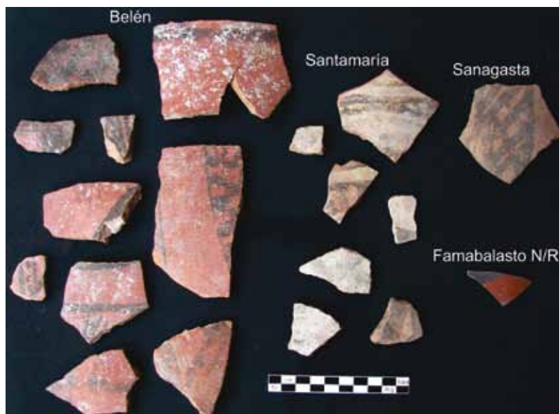
Figura 5. Conjunto de fragmentos pertenecientes a diferentes estilos propios del NOA.

p'uku más (seis o siete) pero quedan opacados por la presencia mayoritaria de urnas.