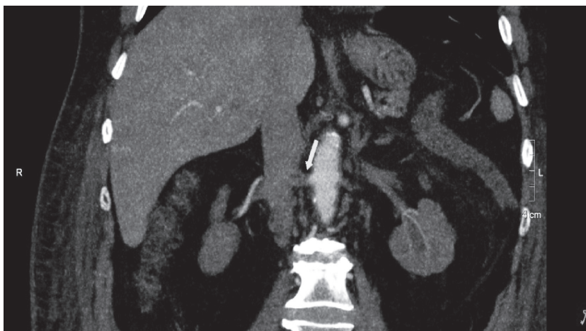
Imagen 2. Angiotomografía renal con contraste endovenoso, corte coronal. Defecto en la opacificación de la arteria renal derecha con reperfusión distal. Hallazgo compatible con trombosis aguda.