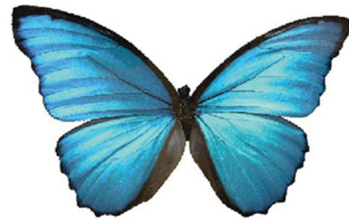
Imagen de una mariposa con sus dos pares de alas membranosas extendidas que evidencia similitud con las imágenes de la tomografía de columna lumbar.

TC multicorte plano coronal y reconstrucción en ventana ósea 3D donde se observa la vértebra transicional con acúñamiento medial, dando el aspecto de alas de mariposa.