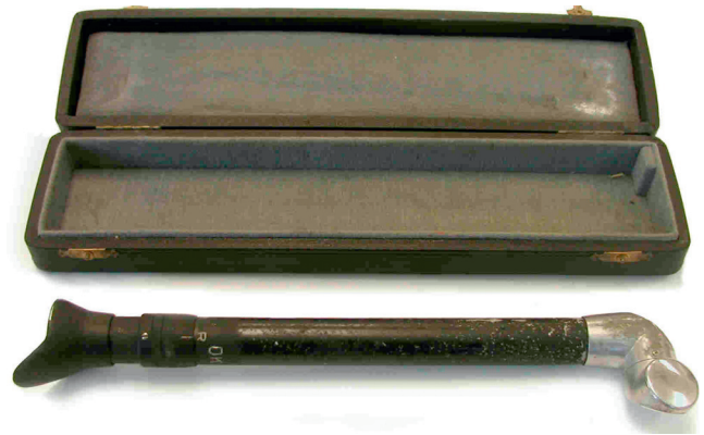
Figura 1 Fluoroscopio intraoral.

El objetivo de los fluoroscopios orales era proporcionar un dispositivo adaptado que permitiese al profesional observar con seguridad y de forma instantánea las condiciones normales y patológicas de las estructuras de los arcos dentales y de las adyacentes a los tejidos blandos, que tienen