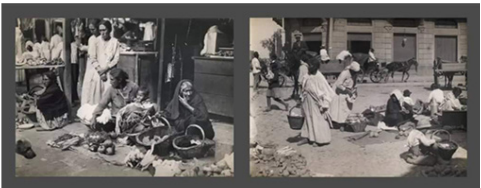
Figura 1: Vendedoras de hortalizas en el casco céntrico, década del 30