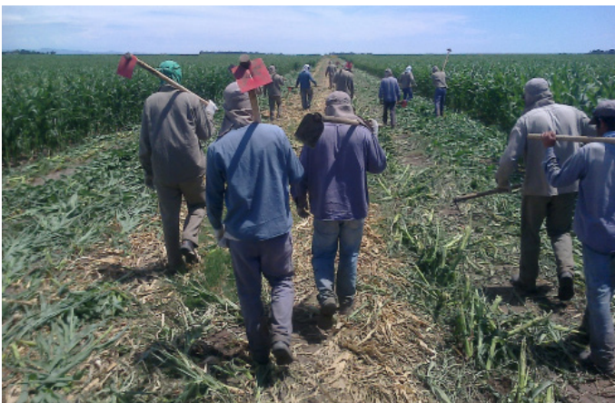
Figura 2: Trabajadores migrantes quichuistas.