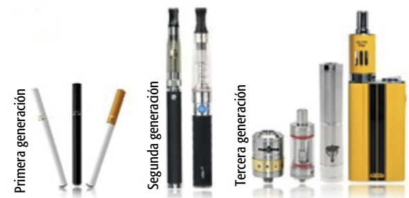
FIGURA 2. Cigarillo electrónico de segunda y tercera generación.