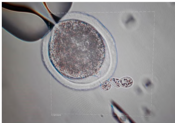
Figura 1. Proceso de enucleación.

Activación y cultivo in vitro de embriones. Los embriones reconstruidos sin signos de lisis fueron incubados por 2 horas en medio TCM-bicarbonato con