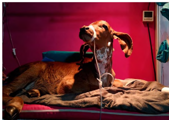
Figura 4. Terneros clonados mediante la técnica de transferencia nuclear de células somáticas (SCNT). A: ternera Gyr Ofelia-C1, en el día del nacimiento. B) ternera Gyr Ofelia-C2.