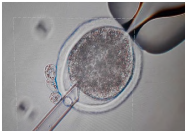
Figura 2. Proceso de transferencia nuclear somática.