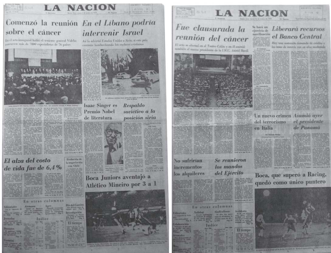
Figura 2. Mención al Congreso Internacional del Cáncer en las tapas del diario La Nación (6 de octubre y 12 de octubre de 1978).