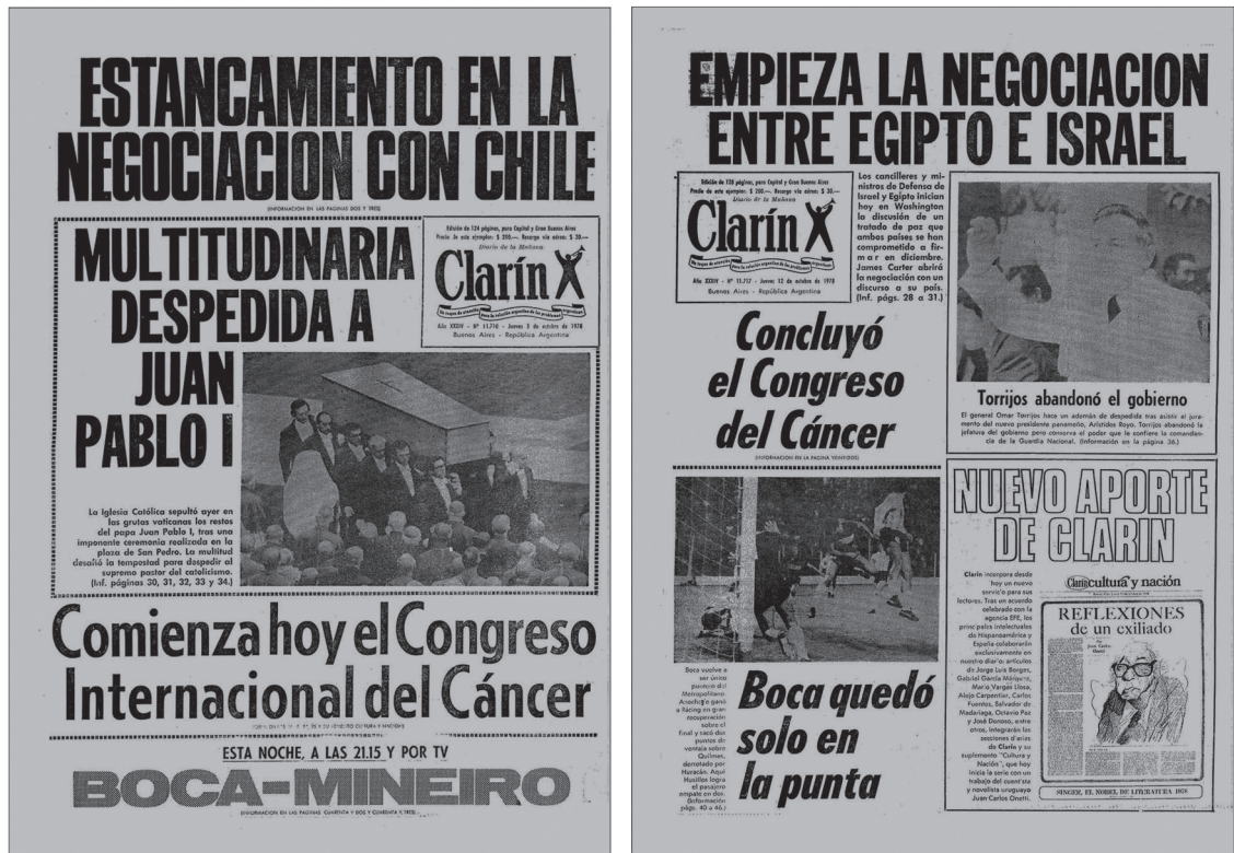
Figura 1. Mención al Congreso Internacional del Cáncer en las tapas del diario Clarín (5 de octubre y 12 de octubre de 1978).

Finalmente, no tiene explicación convincente la actitud del gobierno francés que patrocina oficialmente, con la presencia de un ministro del gabinete, la realización de un llamado “contracongreso”, convocado según la explícita manifestación de sus organizadores para hacer fracasar la reunión por celebrarse en Buenos Aires. (24)